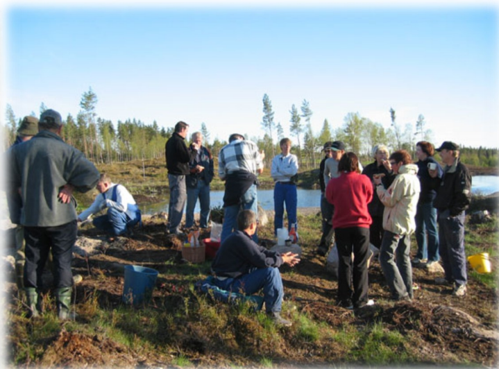
Hål 9 vid rød tee.