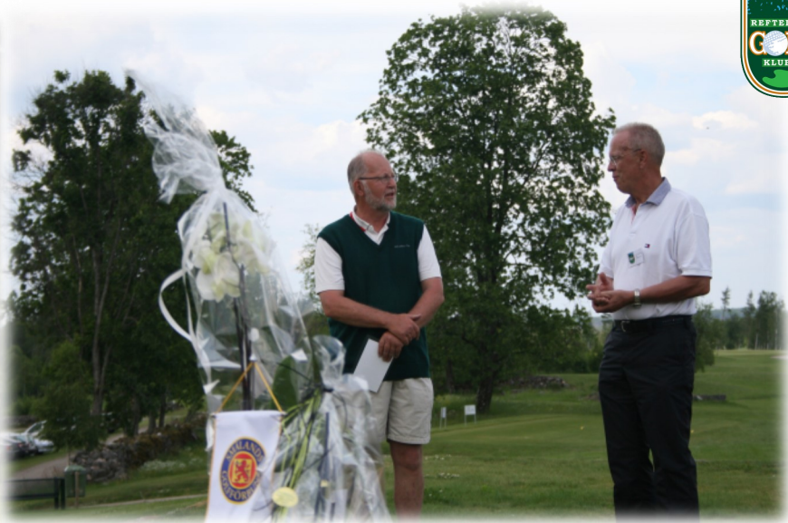
Värnamo GK med flera grannklubbar gratulerade.